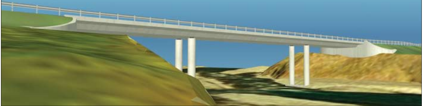
Tölvumynd af fyrirhugaðri brú yfir Norðurá í Skagafirði. Hönnun, brúadeild Vegagerðarinnar.