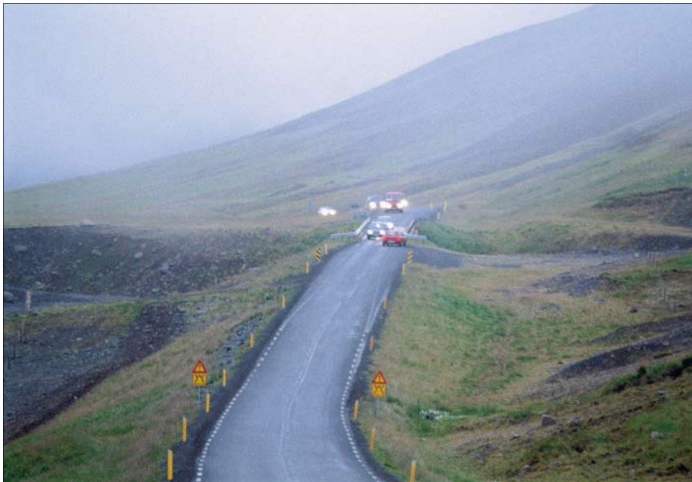
Núverandi vegur um Norðurárdal og einbreið brú.