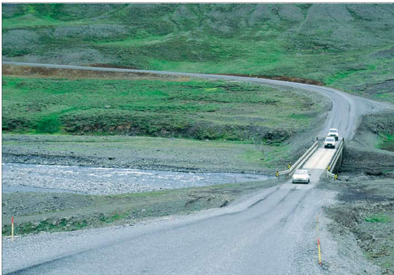
Núverandi brú yfir Norðurá við Heiðarsporð.